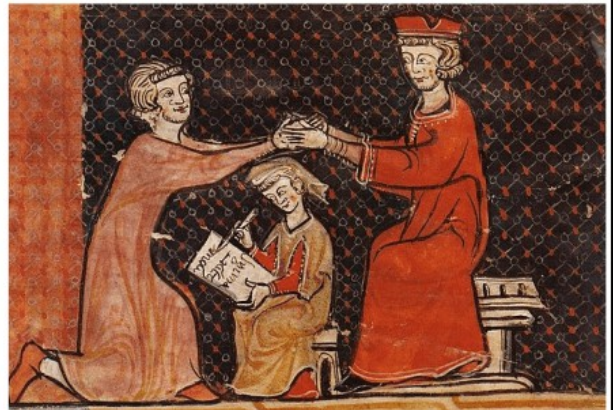
Une cérémonie d'hommage Miniature extraite du Capbreu de Tautavel, XIIIe siècle, Archives départementales des Pyrénées-Orientales - Wikimedia Commons

Les seigneurs châtelains sont à leur tour les vassaux de seigneurs plus puissants. Le Roi est à la tête de cette pyramide vassalique.